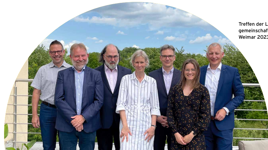
Treffen der Landesforschungsgemeinschaften und Zuse in Weimar 2023

Enge Freunde der JRF sind die Landesforschungsgemeinschaften innBW aus Baden-Württemberg, FTVT aus Thüringen, SIG aus Sachsen und die bundesweite Industrieforschungsgemeinschaft Zuse geworden. Seit 2021 vertreten wir gemeinsam die Interessen unserer Mitgliedsinstitute insbesondere gegenüber der Bundespolitik und tauschen uns regelmäßig über aktuelle Entwicklungen aus.