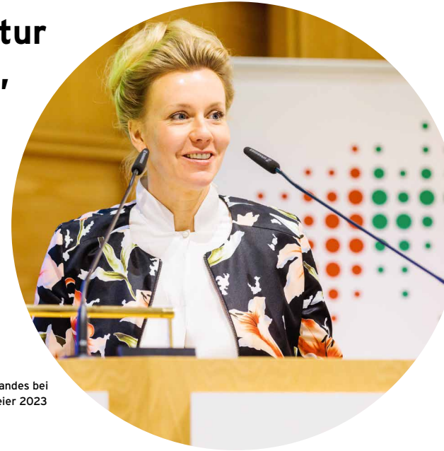
Ministerin Ina Brandes bei der JRF-Jahresfeier 2023

Eine neue Koalition aus CDU und Grünen führt das Land Nordrhein-Westfalen seit 2022. Ina Brandes, Ministerin für Kultur und Wissenschaft, hat der JRF bei der Jahresfeier 2023 ihre Wertschätzung ausgesprochen und Unterstützung zugesagt.