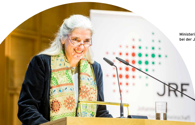
Ministerin Isabell Pfeiffer-Poensgen bei der JRF-Wasserveranstaltung 2018

Eine neue Koalition aus CDU und FDP hat sich nach der NRW-Landtagswahl gebildet. Als Mitglied der Landesregierung hat Isabell Pfeiffer-Poensgen das neu zugeschnittene Ministerium für Kultur und Wissenschaft übernommen, das Mitglied der JRF ist. 2018 hat sie die JRF-Veranstaltung „LebensWert Wasser - Wie verbindet Wasser NRW und die Welt?“ eröffnet.