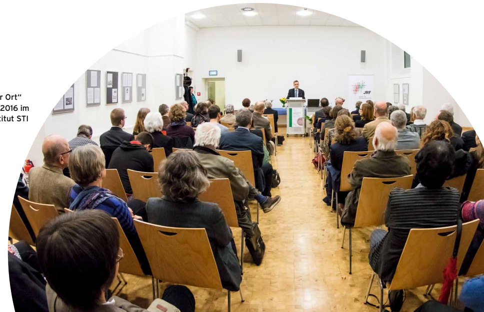
„JRF vor Ort“ am 15.11.2016 im JRF-Institut STI in Essen