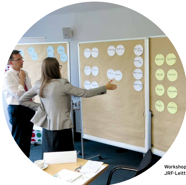
Workshop zur Entwicklung der JRF-Leitthemen am 13.06.2016

Interessierte können im Rahmen der Reihe „JRF vor Ort“, die JRF-Institute an ihren Standorten in unterschiedlichen Veranstaltungsformaten kennenlernen. Bisher haben 16 „JRF vor Ort“-Veranstaltungen stattgefunden.