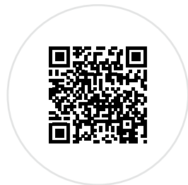
QR-Code scannen und 2-minütigen Erklärfilm ansehen.